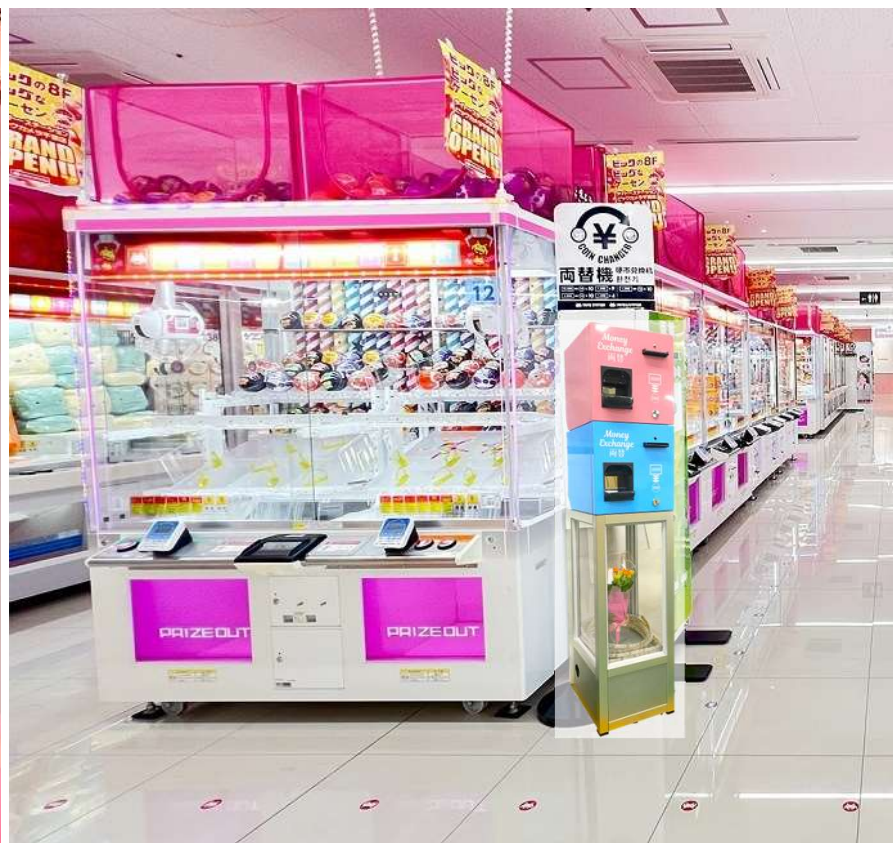
*両替機設置イメージ